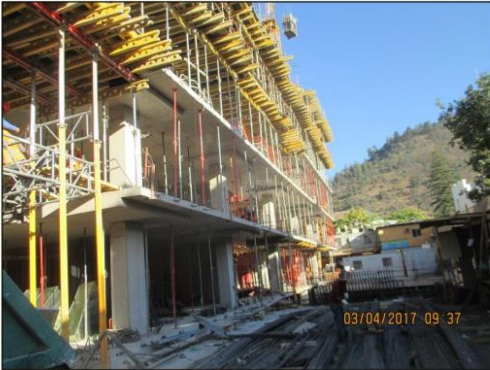
Vista Nor Oriente